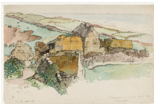
Ruines près de Vauville, dessin de C. Heyman, coll. CD50 - num. A. Poirier/AD50

Dans le cabinet d'art graphique, à travers une sélection de dessins originaux, le visiteur pourra découvrir La Hague des deux descendants du peintre.